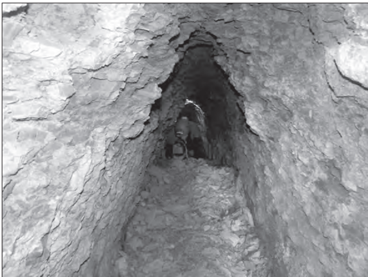
Galería inicial en material en descomposición

La entrada de la Mina de los Frailes es de pequeñas dimensiones y se abre a mitad de ladera en medio de un olivar. Tras la entrada nos encontramos en una pequeña sala de unos 2 metros por 2,5 aproximadamente, donde se abren dos galerías. Una, excavada sobre margas y en continuo estado de degradación,