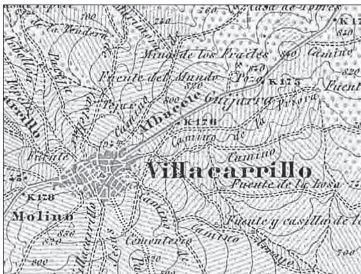
Extracto de plano donde se sitúa la Mina de los Frailes (año 1899)

En los últimos años, algunos de los objetivos principales del Club, han sido la colaboración en diversas actividades subterráneas, tales como el catálogo de fuentes y manantiales de Andalucía en colaboración con la Universidad de Granada y el Instituto Andaluz del Agua de la Junta de Andalucía, el inventariado de las minas de Villacarrillo y la ayuda a la investigación sobre la historia de nuestro municipio. Todo ello unido nos ha dado pie al descubrimiento y exploración de la Mina de los Frailes, un manantial cercano a la localidad y que históricamente ha sido muy importante para Villacarrillo.