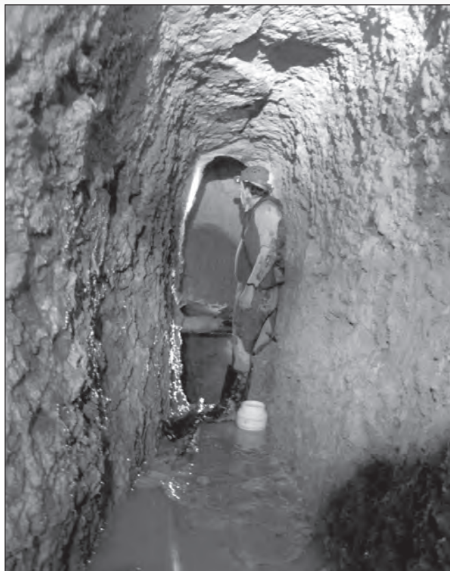
Interior de la Mina de los Frailes, galerías finales

Finalizar este trabajo comentando que en la sala inicial existen vestigios de canalización de agua al exterior, bien por mangueras de PVC enterradas o canalización de piedra. En total, la mina tiene 62 metros de desarrollo explorados, aunque debido a los desplomes y hundimientos comentados, seguramente el desarrollo podría ser aún mayor.